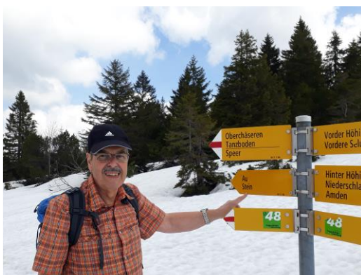
23. Mai 2019: Rekognoszierung im Schnee!